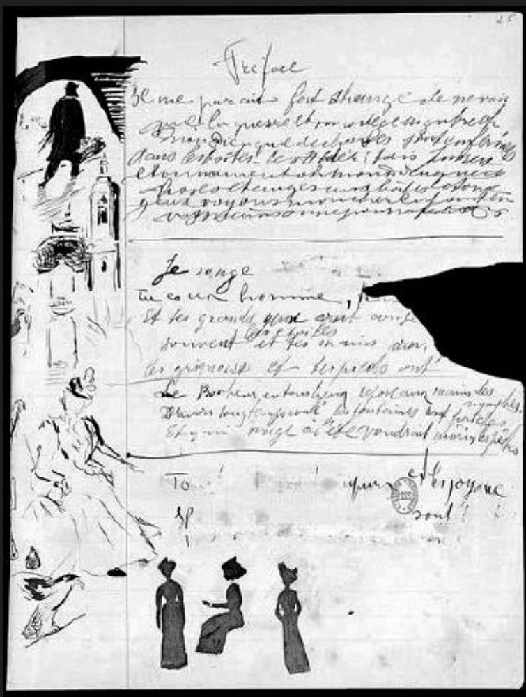
Guillaume Apollinaire, «Cahier de Stavelot» Manuscrit autographe 80 f., 22,5 x 17,5 cm BNF, Manuscrits, N. a. fr. 25604, f. 47